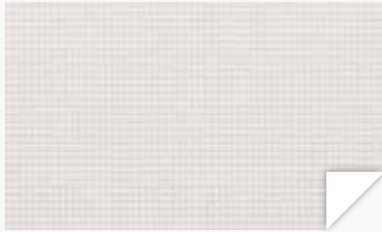
Blanco White / Blanche / Branco / Bianco