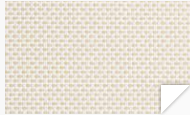
Blanco-lino White-linen / Blanche-lin / Branco-linho / Bianco-biancheria