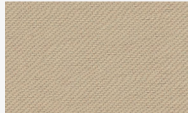
Beige Beige / Beige / Bege / Beige