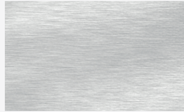
Plata Silver / Argent / Prata / Argento