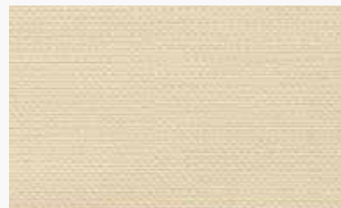
Beige Beige / Beige / Bege / Beige