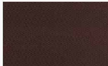
Chocolate Chocolate / Chocolat / Chocolate / Cioccolato