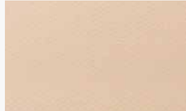
Marfil Ivory / Ivoire / Marfim / Avorio