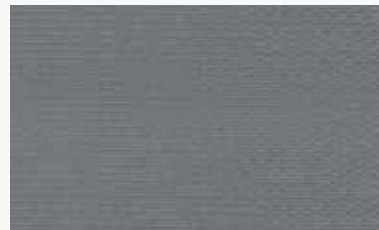
Gris Grey / Gris / Cinza / Grigio