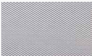
Blanco-gris White-grey / Blanche-gris / Branco-cinza / Bianco-grigio