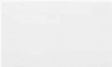
Blanco White / Blanche / Branco / Bianco