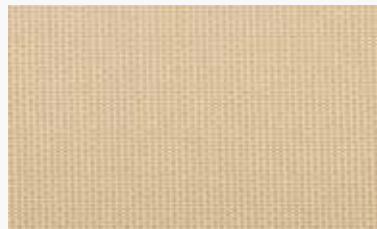
Beige Beige / Beige / Bege / Beige