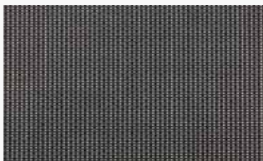
Negro Black / Noire / Preto / Nero

200-1% 12359715 250-1% 12360715 300-1% 12361715