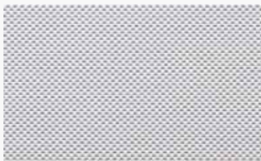
Blanco-gris White-grey / Blanche-gris / Branco-cinza / Bianco-grigio

200-1% 12359115 250-1% 12360115 300-1% 12361115