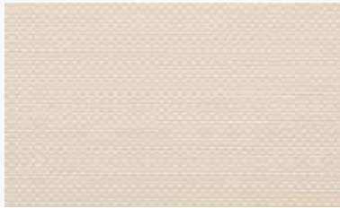
Blanco-lino White-linen / Blanche-lin / Branco-linho / Bianco-biancheria

200-1% 12359910 250-1% 12360910 300-1% 12361910