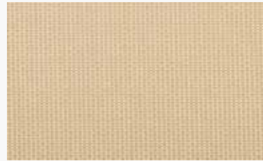
Beige Beige / Beige / Bege / Beige

200-1% 12359991 250-1% 12360991 300-1% 12361991