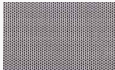
Grafito Graphite / Graphite / Grafite / Grafite

200-1% 12359715 250-1% 12360715 300-1% 12361715